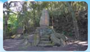
南洲翁開墾地遺跡