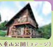
八重山公園(コテージ)